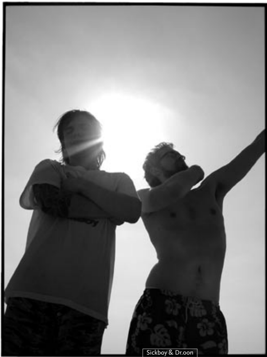
Sickboy & Dr.oon

I can see where i am now (K-RAA-K) 3 Wio vs Kohn (K-RAA-K) 3 Wio (K-RAA-K) 3