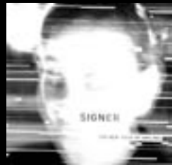
SIGNER - "The new face of smiling" CARPARK RECORDS