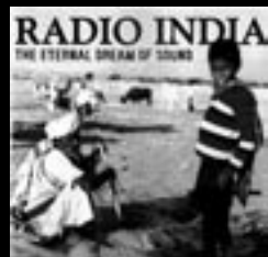
RADIO INDIA - "the eternal dream of sound" SUBLIME FREQUENCIES