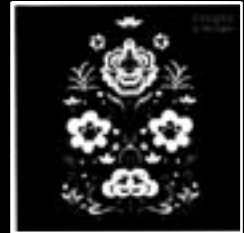
DUNGEN - "Ta det lugnt" SUBLIMINAL SOUNDS